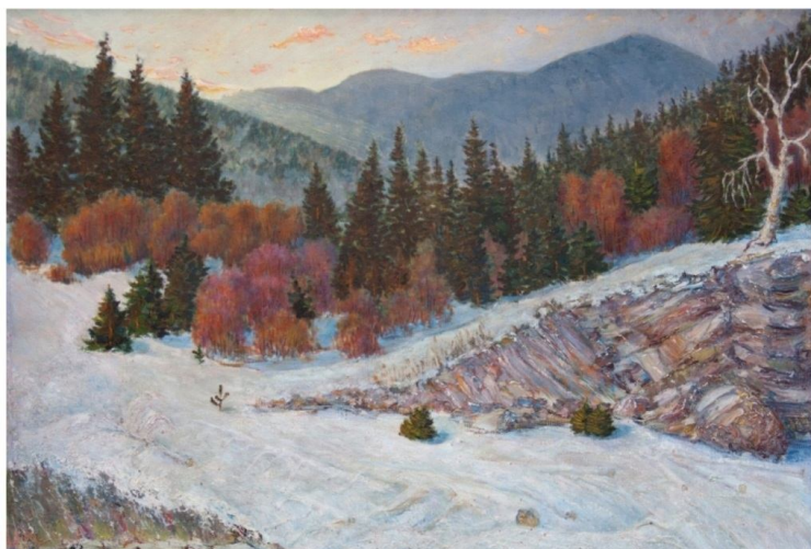
Морозное утро, 1998 г.

Он продолжал активно писать пейзажи, собирать художественные произведения и пополнять коллекцию фондов Абаканской картинной галереи.