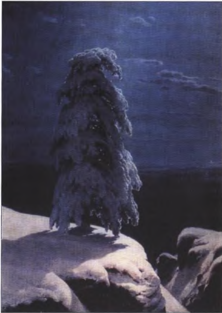
На севере диком. 1891

лориту. Но все что-то силился вспомнить, когда вечерами читал стихотворение Лермонтова: