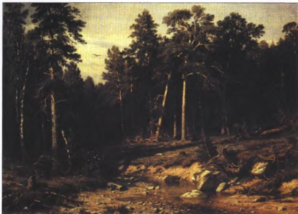
Сосновый бор. 1872

В Московском художественном училище Иван Шишкин серьезно занялся изучением природы, много работал, о его упорстве сочинялись легенды — он мог сделать за одну неделю столько, сколько иной и за месяц не сделает. И первые же рисунки принесли ему успех. Они ходили по рукам, ими «зачитывались до дыр».