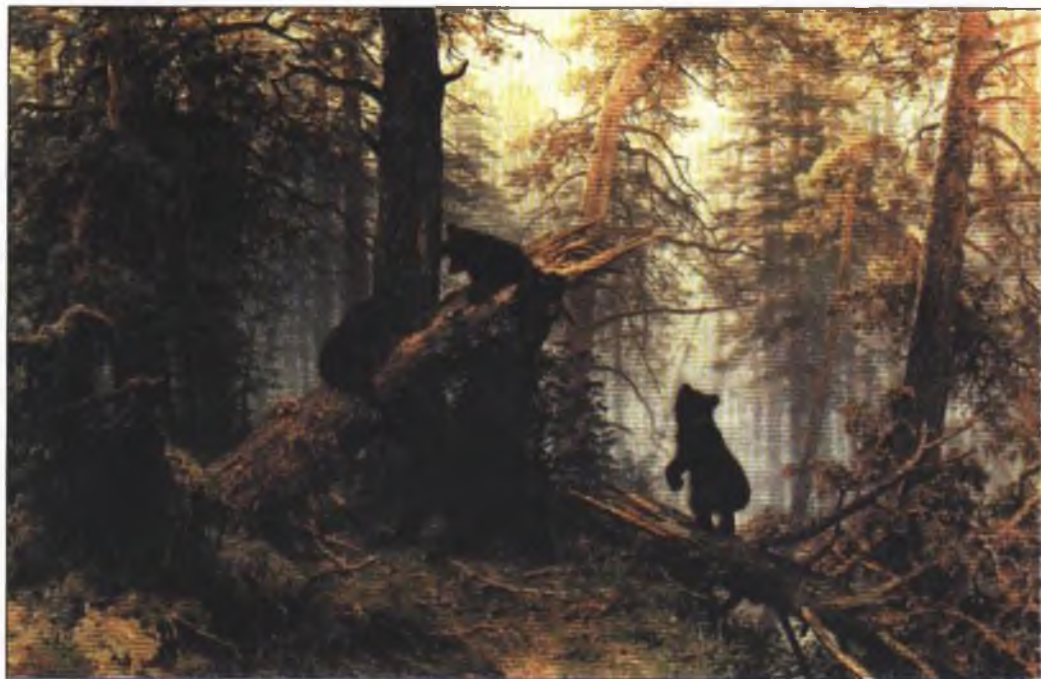
Утро в сосновом лесу. 1889

— Ах, и хорошо! — поразился Иван Иванович. — Ну что ты скажешь! Надо готовить холст.