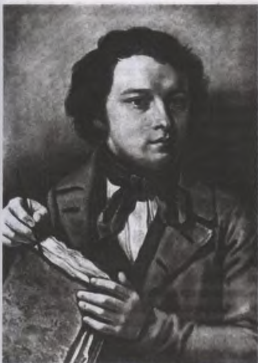
И. Осокин. Портрет И. Шишкина. 1851

ми светлыми облаками, занимающее большую часть полотна. Важную роль играет колорит, сообщающий произведению жизнерадостное настроение. Изображенное вдали село с белой церковью и идущие по дороге крестьяне с граблями вносят в пейзаж жанровое начало.