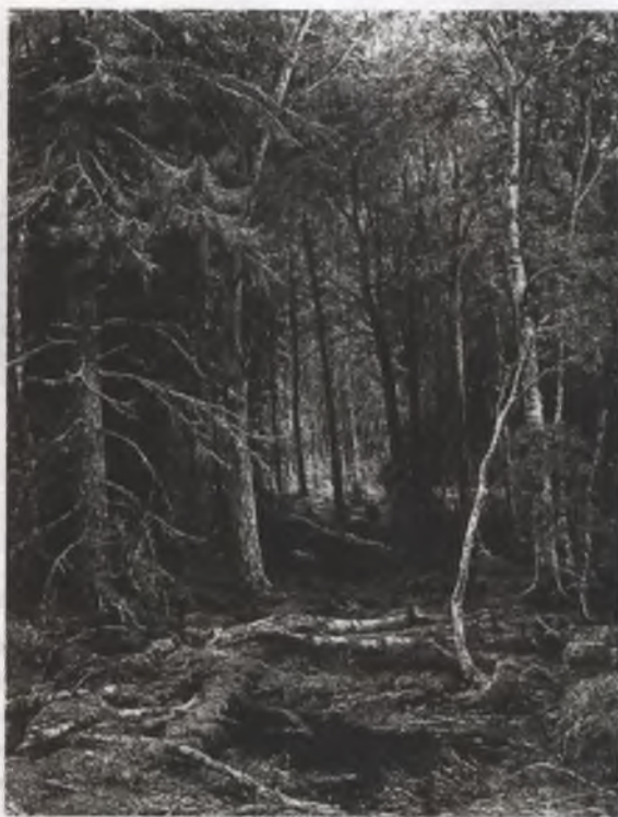
Лесная глушь. 1872

Громадные деревья взяты крупным планом. Срезая рамой вершины, Шишкин приближает дубы к зрителю, они словно вырастают под его взглядом. Художник внимательно изображает морщинистую кору, корявые ветви, зеленую листву, отбрасывающую легкую тень на освещенные стволы, уходящую в глубину рощи полянку. Но при всем внимании к деталям он не утрачивает цельности общего впечатления и, используя игру светотени, рельефно выделив основную группу деревьев, объединяет ее с разросшейся вокруг рощей. Все передано в полнокровной реалистической манере.