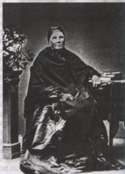
Д. Шишкина, мать художника. 1870-е

Один из лучших — «Дубки под Сестрорецком» (1857), выполненный итальянским карандашом с добавлением белил в наиболее освещенных местах.