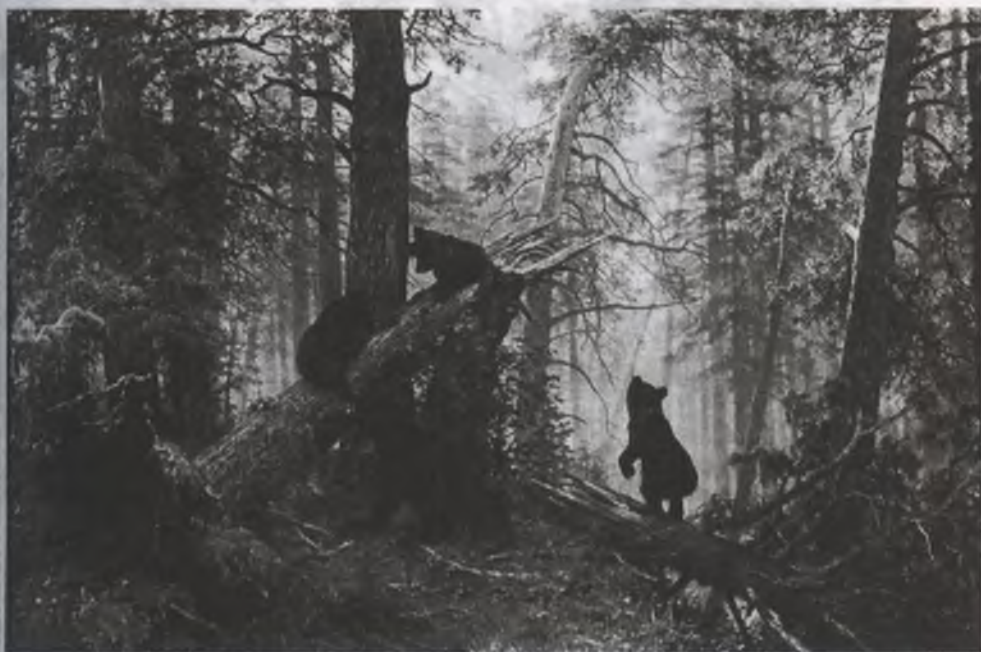
Утро в сосновом лесу. 1889

уехать с ними в деревню и ходить на этюды, то есть работать с ними вместе». Но к педагогической деятельности Шишкин смог приступить лишь с 1894 года, когда после реформы Академии художеств стал профессором — руководителем пейзажной мастерской Высшего художественного училища.