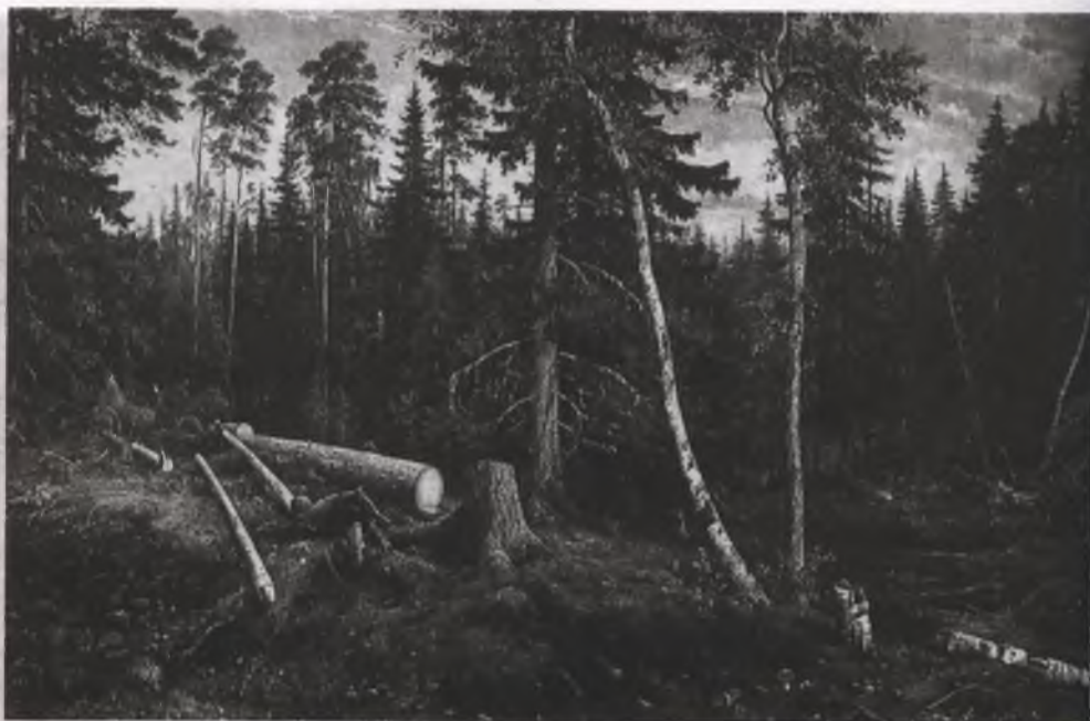
Рубка леса. 1867

К 1891 году относится написанная, по-видимому, совместно с Савицким картина «Дождь в дубовом лесу». В ней зрителя привлекает мастерское изображение мокрой листвы, влажных стволов, затуманенного дальнего плана, усиливающих ощущение мелкого непрекращающегося дождя.