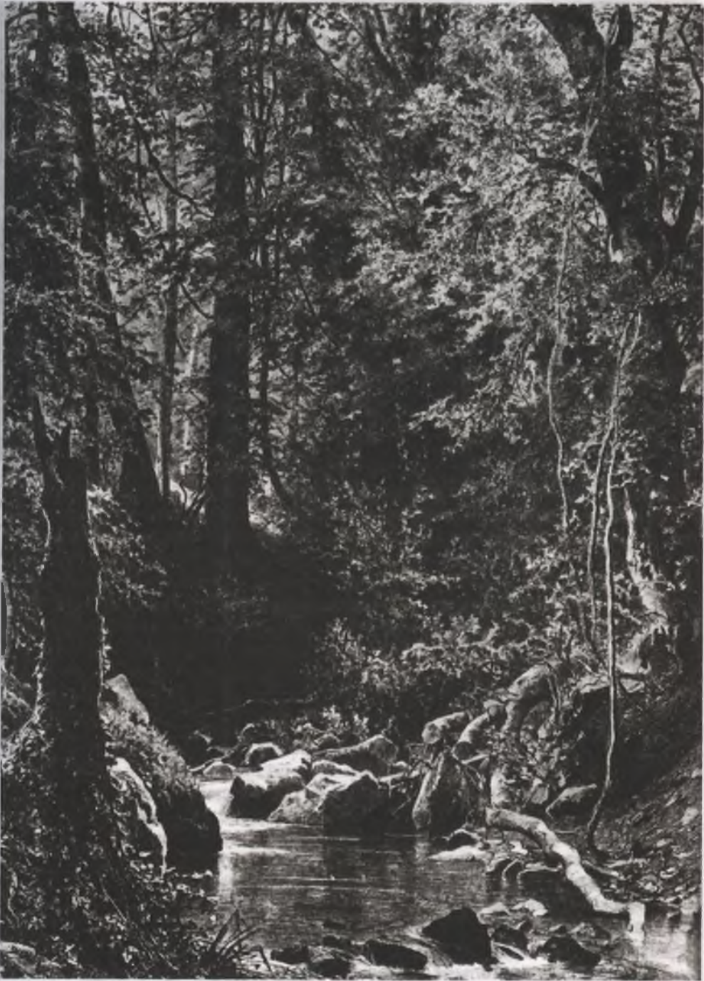
Ручей в лесу. 1880

покрытое мхом», основанные на скрупулезном изображении мельчайших деталей. А главное, он по-прежнему продуманно решает задачу большого композиционного пейзажа-картины, синтезируя в своих полотнах весь опыт многолетнего изучения русской природы. Его живописные приемы становятся богаче и разнообразней; колорит приобретает большую цельность и красоту.