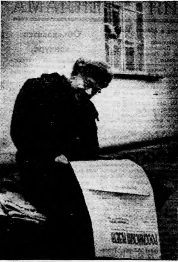
Что нового?