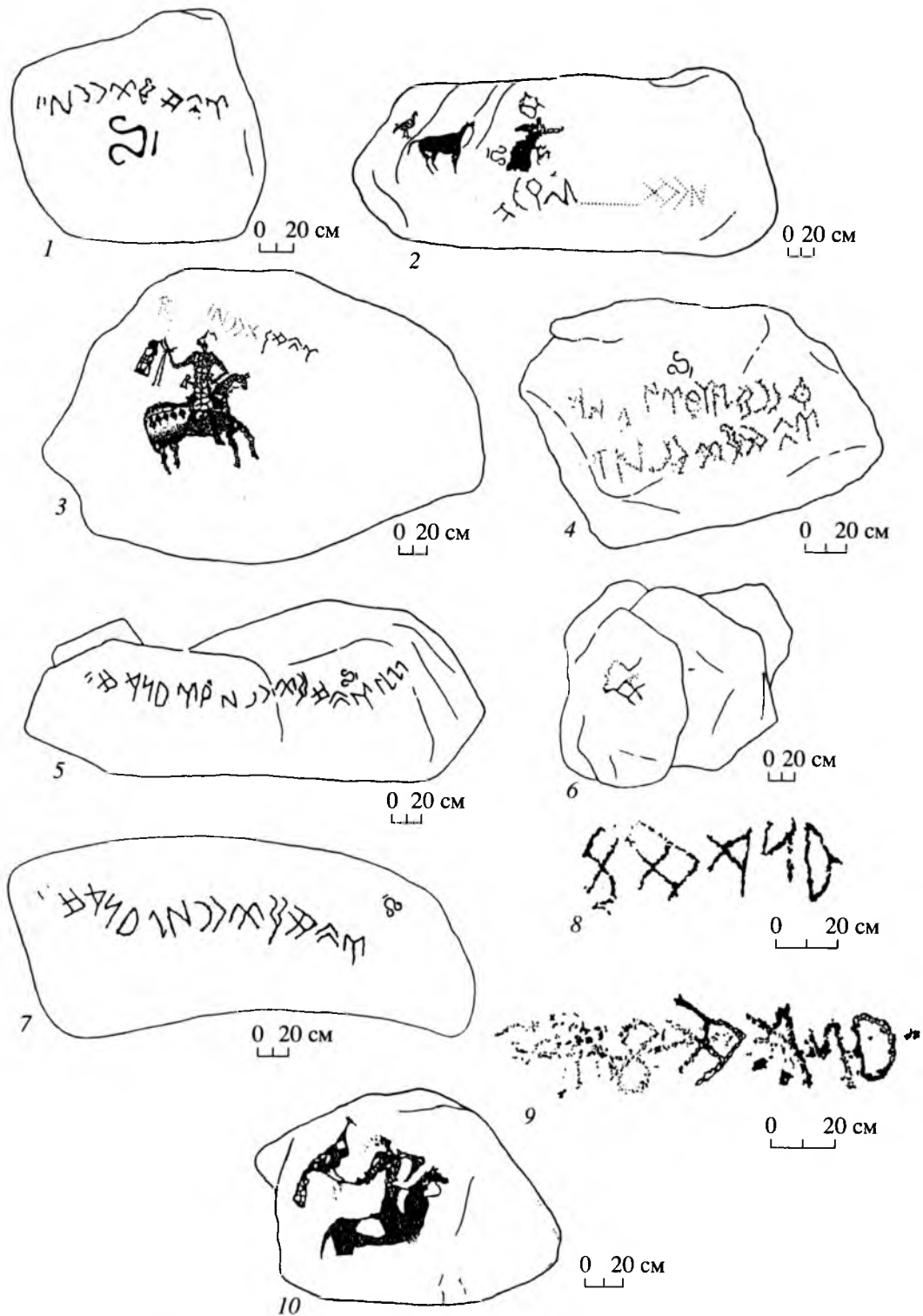
Рис. 1. Надписи и изображения урочища Кок-Сай. По К.Ш. Табалдиеву и О.А. Солтобаеву.

казывают, что оно применялось и в наскальных начертаниях таласского письма. В енисейских же наскальных надписях этот речевой оборот до сих пор не встречен ни разу. Переводить слово eg , обозначавшее в раннем средневековье не столько возраст, сколько социальный статус свободного