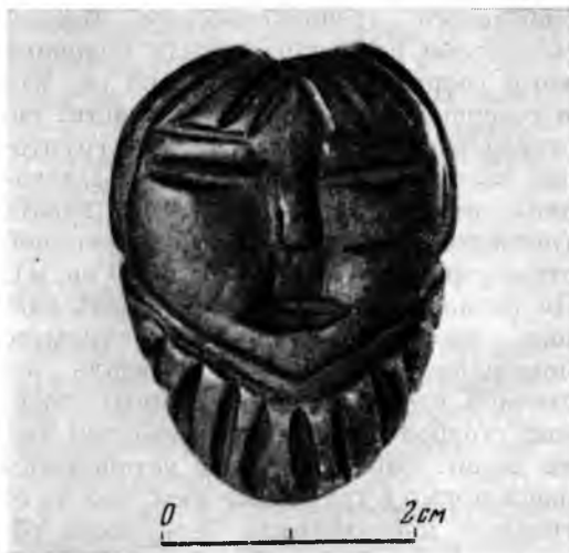
Амулет-подвеска из гальки. Стоянка в бухте Токарева