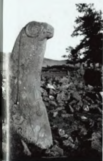
Изваяние № 111 на Усть-Бюрьском чаатасе. Фото И.Т. Савенкова, 1911 г.