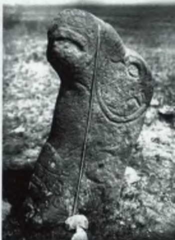
Изваяние «Верхбиджинский баран» на изначальном месте. Начало 1950-х гг.

но и назначения обычных менгиров. Верхняя их часть большой протяженности, свободная от изображений на многих изваяниях, ассоциировалась с далеким небесным пространством. Нижние части памятников, соприкасавшиеся с землей или закапывавшиеся в нее, воспроизводили образы подземного, потустороннего мира.