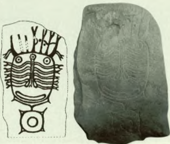
Вторая стела могильника Верхний Аскиз 1. Массивная плита с выбитым изображением личины «разливского» типа перекрывала одну из могил кургана 2. Была положена изображением книзу

Несмотря на прошедшие тысячелетия, в наших землях все еще сохранилось около трехсот таких скульптур. Это обработанные со всех сторон каменные столбы. Даже когда на них нет изображений — у них всегда овальное поперечное сечение. В большинстве случаев скульптуры сильно сужаются кверху и имеют сутулую, изогнутую спину. В нижней их трети, над самой выпуклой частью, рельефно высечена крупная личина с широким лбом и очень узким подбородком. Подойдите ближе, и на вас уставятся далеко расставленные круглые колеса неподвижных глаз, вы различите вздувшиеся ноздри и растянутый, искаженный неслышным ревом рот. Кверху вздымаются длинные острые уши и громадные изогнутые рога. Да ведь это корова с очеловеченным ликом! Мифический образ.