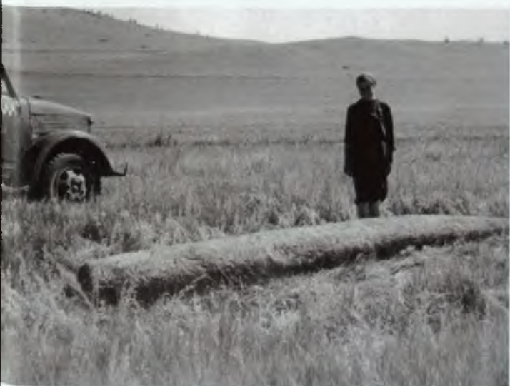
Изваяние Киме-тас лежало у горы Хызыл-хас близ озера Чёрного в Ширинском районе. Вывезено в Абакан в 1950-х гг.

но и назначения обычных менгиров. Верхняя их часть большой протяженности, свободная от изображений на многих изваяниях, ассоциировалась с далеким небесным пространством. Нижние части памятников, соприкасавшиеся с землей или закапывавшиеся в нее, воспроизводили образы подземного, потустороннего мира.