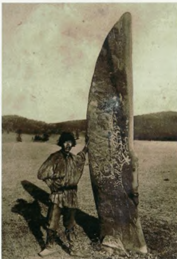
Изваяние Аптах-тас в окрестностях улуса Тазмин, на левом берегу реки Бюрь (Усть-Абаканский район). В 1921 г. вывезено археологом С.А. Теплоуховым в Петроград. Фото 1910-х гг.

Менгиры тоже выполняли функции изваяний. Возможно, камни расписывались не сохранившимися до наших дней красками, то есть первоначально имели изображения. Это позволяет использовать образы изваяний для уяснения смысла не только древнейших каменотесных скульптур,