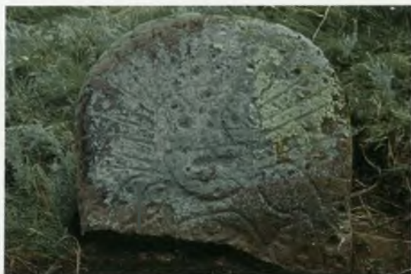
Солнечное божество близ аала Батанакова. 1978 г.

Божества верхнего мира и выпускают вниз змея, однако до того, как поглотить земную жизнь-корову, он оплодотворяет ее (иногда это делает само небесное божество). Потому и выпуклы нижние части скульптур — они беременны новой жизнью, а груди женщины-коровы полны молоком. Все это и поглощает смерть. Нескончаемая жизнь в цепи вечного перехода рождения и смерти друг в друга — вот основа мифологии, некогда воплощенной и окаменевшей в межгорных долинах Хакасии. Вполне вероятно, что Природа представлялась предкам в виде мифического первосущества, лик которого ныне глядит на нас из камня и части тела которого стали основными частями ландшафта после его легендарной гибели — горами, лесами, реками.