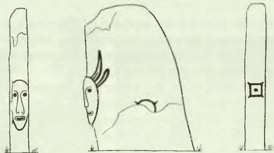
Изваяние № 24 из окрестностей с. Солёноозёрное. Ширинский район. Находилось в 1 км от села, по дороге на станции Шира