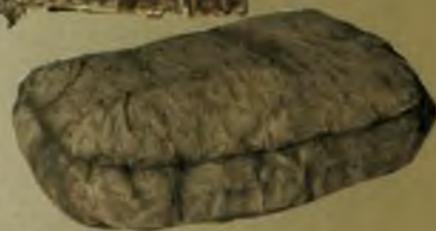
Погребальная маска и предметы одежды из Оглахтинской гробницы, хранящиеся в Государственном Эрмитаже