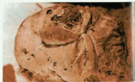
Голова куклы с сожженным прахом (набитая травой). 1903 г.

ла. Это выполненный в рост человека своеобразный манекен — погребальная кукла. Она одета в соболью доху, на ногах — меховые сапоги с завязками. Голова сшита из шелка. На ткани темно-красной краской нарисовано лицо: брови, глаза, нос и рот. На темени пришита подковообразно уложенная косичка из каштановых человеческих волос. Под головой куклы лежали друг на друге две кожаные подушки, набитые сухой травой. Под головы скелетов подложены деревянные подушки и каменные плиты.