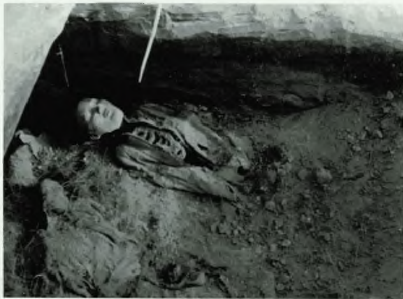
Одно из захоронений Оглахтинского могильника. 1969 г.

Загадка такого необыкновенного захоронения усложнилась, когда под телом женщины обнаружили вторую куклу. Она была одета в меховую куртку, на голове — человеческий скальп с волосами, а под головой — старая кожаная подушка. Эта кукла была опущена в гробницу раньше умершей женщины и первой куклы, вероятно, при захоронении мужчины. Таким образом, гробницу раскрывали в древности неоднократно и хоронили вновь умерших. Сначала был погребен мужчина и нижняя кукла,