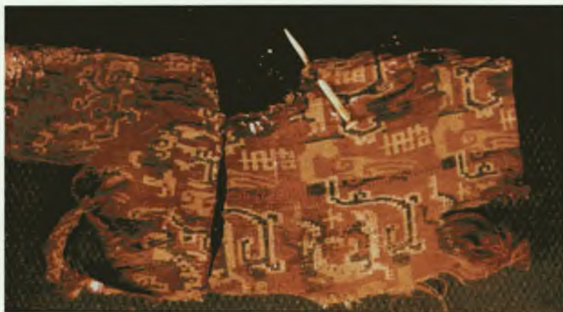
Обтянутая шелком берестяная часть женского головного убора

Известно, что при гуннах в среднем течении Енисея поселились тюркоязычные племена, которые смешались с местными группами древних угров и самодийцев. Культуру этих племен археологи условно называют таштыкской. Начавшись в I веке до н.э., таштыкская культура существовала и после ухода гуннов, вплоть до VI века, когда на Енисее возникло Древнехакасское государство.