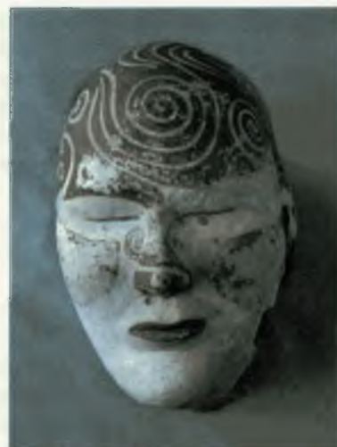
Портретная маска женская. 1969 г.

По знакомой горной долине ехал верхом пастух. Вдруг конь его провалился в глубокую яму. Из темноты провала на пастуха смотрело белое человеческое лицо... Он с криком выбрался на поверхность и в ужасе умчался прочь. Так в 1902 году в горах Оглахты был открыт почти не имевший внешних признаков могильник рубежа нашей эры.