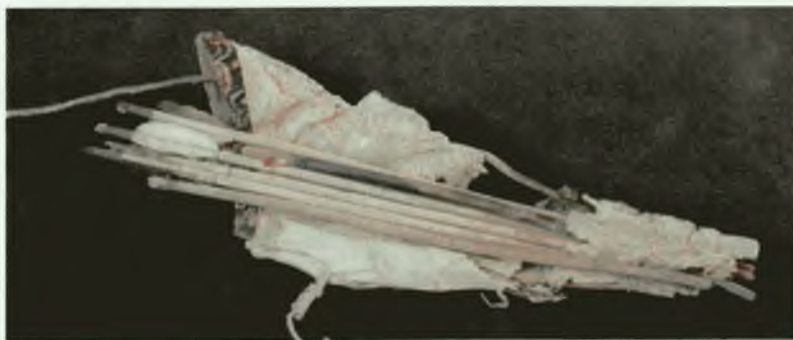
Таштыкская модель саадака с луком и стрелами. Раскопки Л.Р. Кызласова