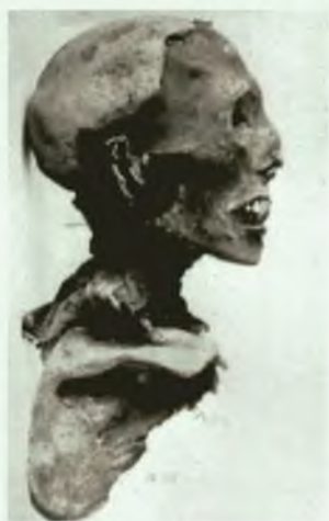
Голова мумии. Раскопки А.В. Адрианова

затем в ноги им положен ребенок, потом погребена новая кукла и, наконец — женщина.