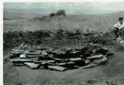
Оглахтинский курган № 1. 1959 г. XI–XII вв.

земли. В одной из них были замечены обрывки бересты. Они-то и помогли найти надежно скрытое захоронение. Сняв полуметровый слой земли, археологи увидели неповрежденный верхний покров крыши погребальной камеры (площадь 2,8 x 2 м), состоящий из четырех слоев толстой бересты, содранной некогда со старых, могучих берез. Несколько слоев бересты герметично ограждали камеру от земляных стенок и пола ямы, не пропустив внутрь ни капли влаги в течение двадцати