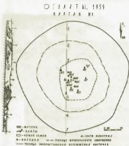
План и схема расположения находок в кургане Оглахты. Выполнен Л.Р. Кызласовым в 1969 г.

веков. Могила находилась на склоне горы, по которому стекали дождевые и талые воды. В сухом грунте хорошо сохранились предметы из дерева, кожи и меха, ткани, волосы и сухая трава. Археологи получили редчайшую возможность увидеть в первозданном виде все детали погребального культа.