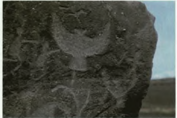
Взлетающие орлы и поклонение им. III–II вв. до н.э. Ранний железный век, тагарская культура