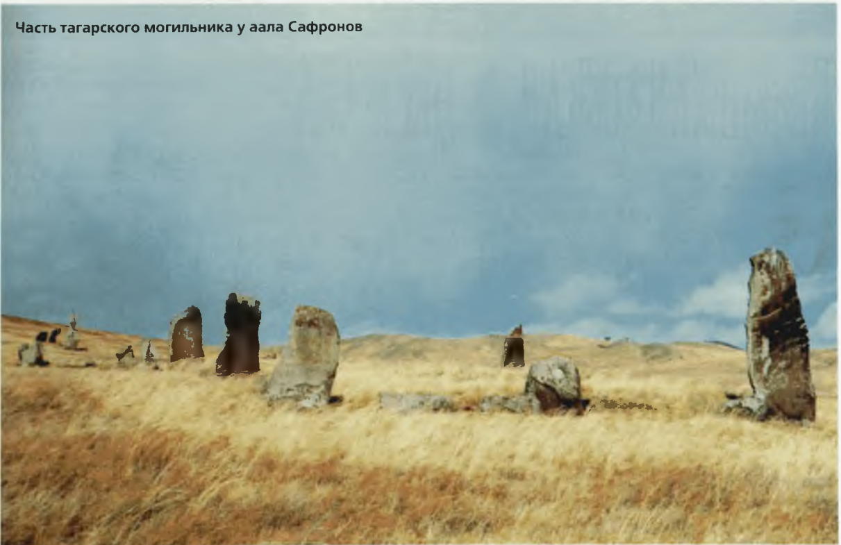
Часть тагарского могильника у аала Сафронов

Тысячелетие назад у подножия древних монолитов писец и книжник средневековья вслушивался в бег шумливых струй Еси. Сложные философские искания побудили его нанести надпись на скальную плоскость. Он считал грамотность добродетелью и был действительно хорошо образован (в тексте применены термины согдийской и иранской религиозной литературы), а жизнь, видно, складывалась нелегко.