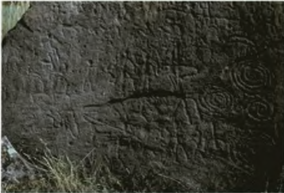
Человекоподобные фигуры и спирали. III–II вв. до н.э. Ранний железный век, тагарская культура