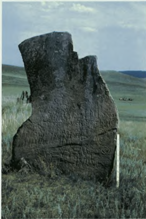
Курганные камни у аала Сафронов