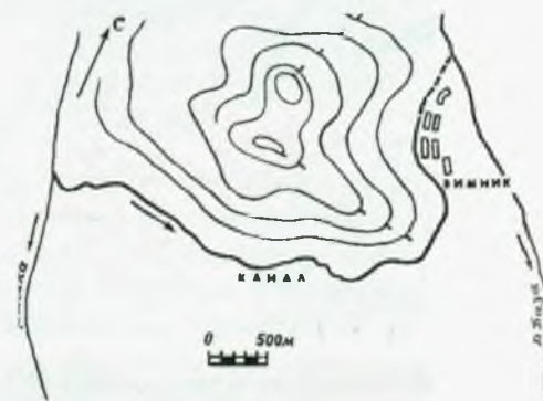
Схема соединительного канала между реками Бейка и База

На Уйбатском канале сохранившаяся древняя головная плотина, сложенная из земли и камня, еще в начале нашего века достигала 4 метров высоты. Другая дамба при длине в один километр сохра-