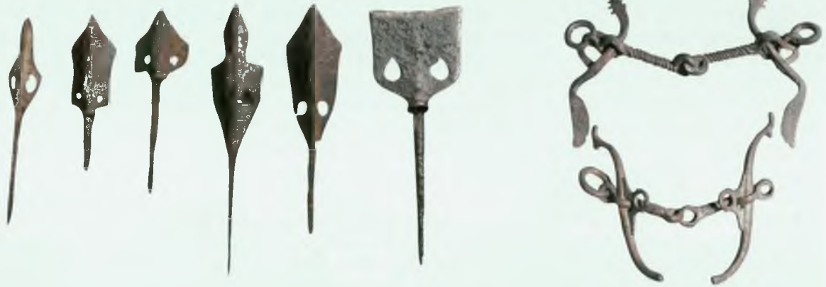
Броневойные наконечники стрел, железные удила с псалями древнехакасского периода. IV–X вв. н.э.

Мощь власти опиралась на регулярную армию. Летопись указывает: «строевого войска 80 000», то есть речь идет о бронированной коннице. Для сравнения вспомним, что десять веков спустя при Бородине (в 1812 г.) встретились две армии в 130 000 (Франция) и 110 000 человек (Россия). Древнехакасское войско разделялось на подразделения: тумены (по 10 000 человек), тысячи, сотни и десятки. В 20-летней войне IX века выросли опытные полководцы, возглавлявшие дальние походы: на Средний Иртыш, города Восточного Туркестана, к верховьям Амура. Экспедиционные корпуса достигали 70 тысяч воинов. Трудно представить, какова была потребность такого войска в железе и стали, бронзе и олове, снаряжении и амуниции.