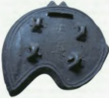
Чугунные лемехи древнехакасского плуга

нилась на высоту 2 метра, а ее толщина в основании была 5–6 метров.