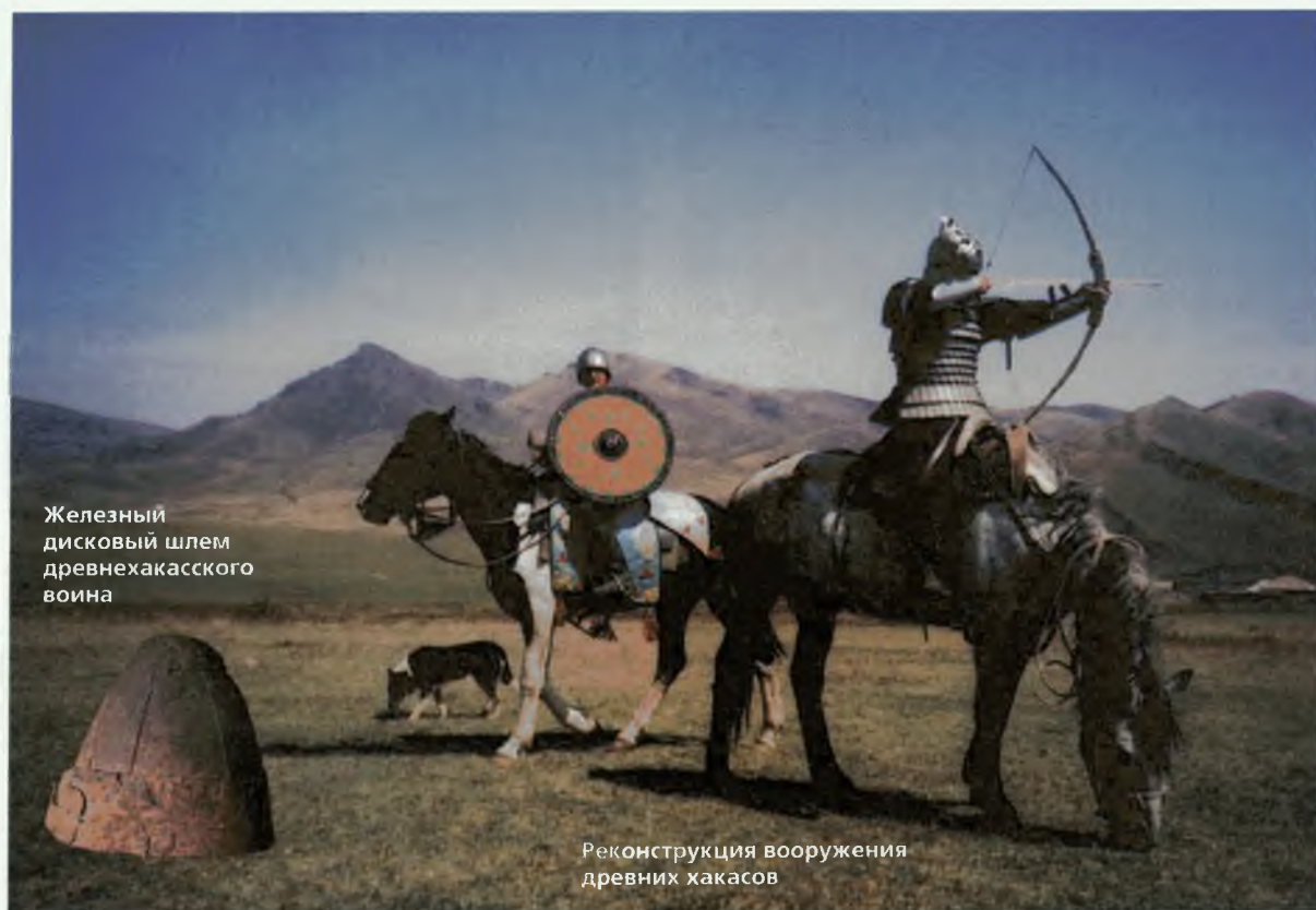
Железный дисковый шлем древнехакасского воина