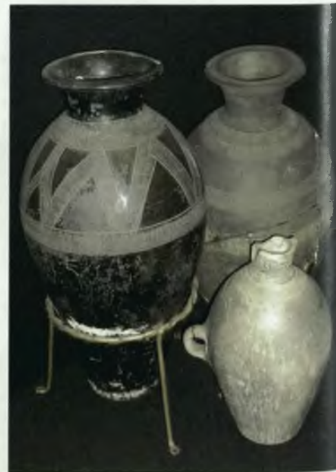
Кыргызские вазы. IX–X вв. н.э.

Когда вновь появились описания хакасских земель, сделанные пришедшими в Среднюю Сибирь русскими, в них уже не оказалось упоминаний городов, орошаемого земледелия, рудников, письменности и многих иных давних достижений местного общества. Все это было утрачено в изнуряющем противодействии чужеземному игу.