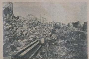
Верденъ, разрушенъ домъ.