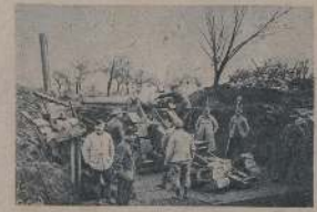
Послѣдній выстрѣлъ въ Верденѣ.