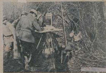
Солдаты обстреливали изъ пушекъ изъ окоповъ.