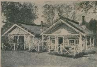
Домы военнаго городка въ концѣ 1914 г.

Въ военномъ городкѣ имеются 15 домовъ. Комитетъ ком. Стрелковъ продолжаетъ работу по строительству домовъ. Въ настоящее время въ военномъ городкѣ имеется 30 домовъ. Комитетъ ком. Стрелковъ продолжаетъ работу по строительству домовъ. Въ настоящее время въ военномъ городкѣ имеется 45 домовъ.