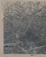
Поджиганъ убитъ, разрушенъ домъ, разрушенъ домъ.