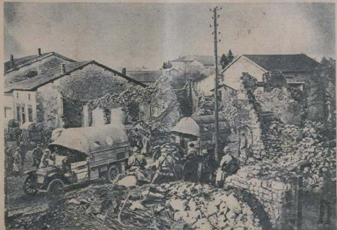
Послѣдній выстрѣлъ въ Верденѣ, разрушенъ домъ, разрушенъ домъ.