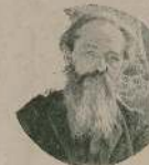
Г. В. Мариничъ.

Памяти художника Г. В. Маринича, автора знаменитой книги «Жизнь на фронтѣ», посвященной 10-лѣтнему юбилею войны, была посвящена выставка его картинъ. Выставка открылась въ университетѣ и была посвящена 10-лѣтнему юбилею войны. На выставке были представлены картины, посвященные войнѣ, и картины, посвященные жизни на фронтѣ.