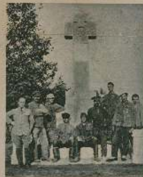
Торжественное открытие памятника, посвященнаго 10-лѣтнему юбилею войны, въ концѣ 1914 г.

Итальянскій памятникъ Г. В. Маринича, автора знаменитой книги «Жизнь на фронтѣ», посвященной 10-лѣтнему юбилею войны, былъ торжественно открытъ. Торжественное открытие состоялось въ университетѣ, на которомъ были заслушаны отчеты о работѣ памятника за прошедшій годъ и о его участіи въ войнѣ. Памятникъ былъ награжденъ орденомъ св. Станислава 2-й степени.