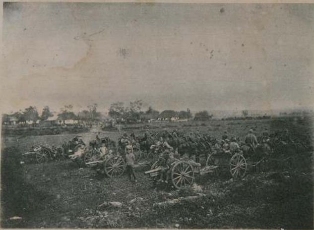
Вид с фронта. Вдали видны горы. Впереди — артиллерия и войска.