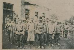
Торжественное открытие памятника, посвященнаго 10-лѣтнему юбилею войны, въ концѣ 1914 г.