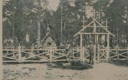
Видъ изъ центра въ военномъ.