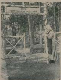
Входъ въ военный городокъ.