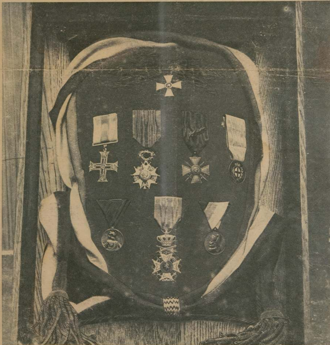
Знаки отличія, пожалованные городу Вердену главами союзныхъ державъ: сверху—орденъ св. Георгія 4-й ст.; слѣдующій рядъ—англ. военный крестъ, орденъ Почетнаго Легиона, франц. военный крестъ и итал. золотая медаль за храбрость; нижній рядъ—сербская золотая медаль за храбрость, бельгійскій крестъ Леопольда I и черногор. золотая медаль Милоша Обилича.

Въ концѣ церемоніи врученія знакомъ военного отличія Вердена Р. Пуанкаре сообщилъ, что японскій императоръ пожаловалъ Вердену почетную саблю. Генералъ Жилингей былъ представителемъ Россіи на торжествѣ въ Верденѣ.