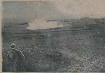
Верденъ, разрушенный домъ, разрушенъ домъ.