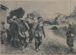
Нападѣніе на Верденъ, разрушенъ домъ, разрушенъ домъ.