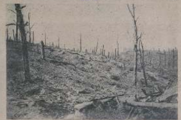
Верденъ, разрушенный домъ, разрушенъ домъ.