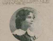
Г. В. Мариничъ.

Таинственное исчезновение учителей Г. В. Маринича, автора знаменитой книги «Жизнь на фронтѣ», посвященной 10-лѣтнему юбилею войны, было предметомъ разсказа. Разсказъ описываетъ таинственное исчезновение учителей, которое произошло въ военномъ городкѣ. Разсказъ былъ опубликованъ въ журнале «Искры».