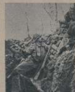
Место разрушеннаго дома.