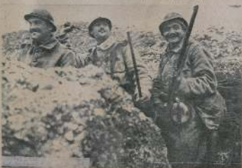
Роты въ окопахъ, разрушенъ домъ.