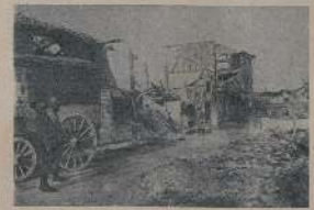
Путь къ деревушкамъ, занятыхъ французами, въ оккупированномъ Верденѣ.