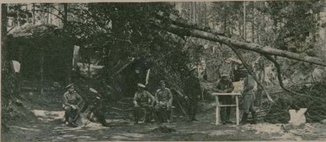
На фронте. Коммунальный пункт.