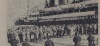
1915 год. Солдаты в строю на русском фронте.