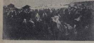
1915 год. Солдаты на русском фронте.