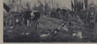
1915 год. Разрушенное село на русском фронте.