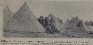
1915 год. Солдаты на русском фронте.