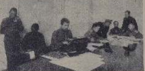
Совет рабочих депутатов в здании бывшего музея на 10-й линии, недалеко от Александровского сада.

В этот вечер в здании собрался совет рабочих депутатов. В этот вечер в здании собрался совет рабочих депутатов. В этот вечер в здании собрался совет рабочих депутатов.