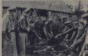
Совет рабочих депутатов в здании бывшего музея на 10-й линии, недалеко от Александровского сада.