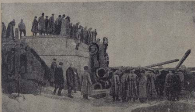
Отступление от Риги. Эшелон с артиллерией.