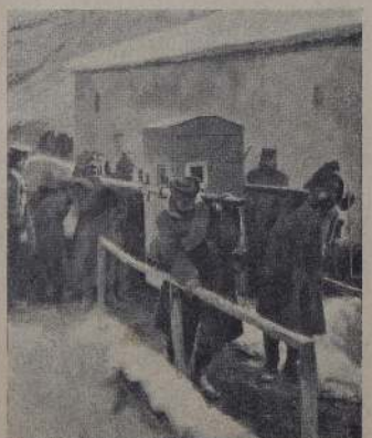
1915 год. Солдаты на позициях в траншеях на русском фронте.