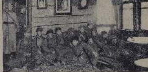
Совет рабочих депутатов в здании бывшего музея на 10-й линии, недалеко от Александровского сада.