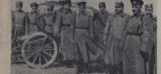
1915 год. Солдаты на русском фронте.