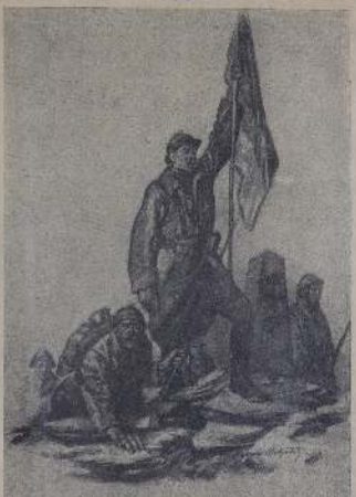
1915 год. Солдаты на русском фронте.