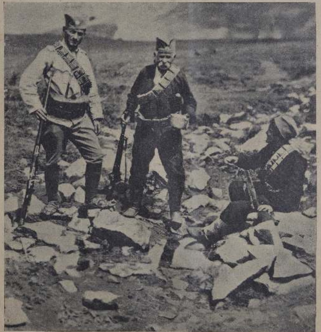
В горах—жизнь солдатская и солдатская. В горах—жизнь 14, иногда 17 и иногда 24 лет.