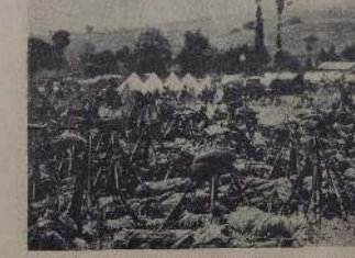
1915 год. Солдаты на русском фронте.