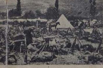
1915 год. Солдаты на русском фронте.