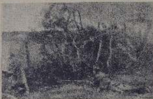
Совет рабочих депутатов в здании бывшего музея на 10-й линии, недалеко от Александровского сада.