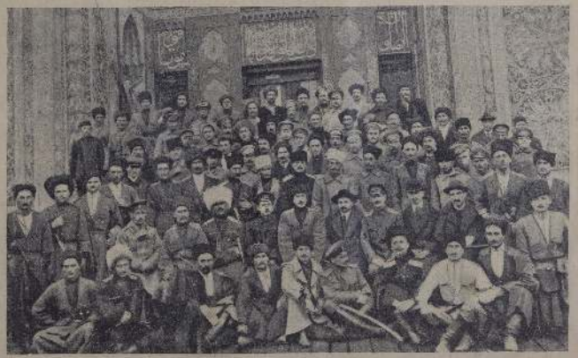
Линия отступления от Риги. Эшелон с артиллерией.