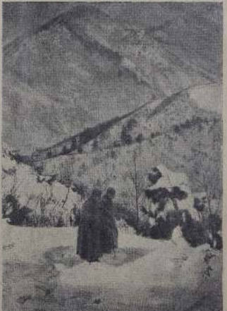
1915 год. Солдаты на русском фронте.