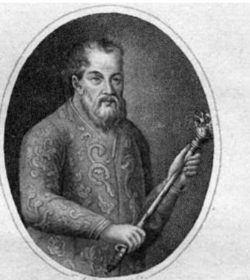
Князь Дмитрий Михайлович Пожарский, Боярин.

императора Александра I. Это был первый в истории России памятник, установленный не царю или полководцу, а народным героям — «гражданину Минину и князю Пожарскому».