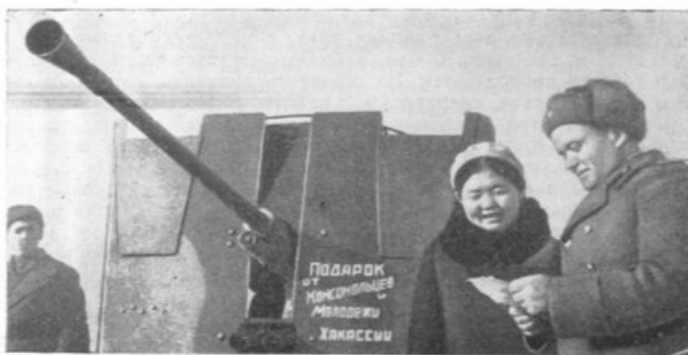
Момент передачи орудия, построенного на средства молодежи Хакассии, январь 1943 г.

С патриотическим подъемом проходит подписка. Трудящиеся Хакассии отдают свои трудовые рубли на дело окончательного разгрома гитлеровской Германии.