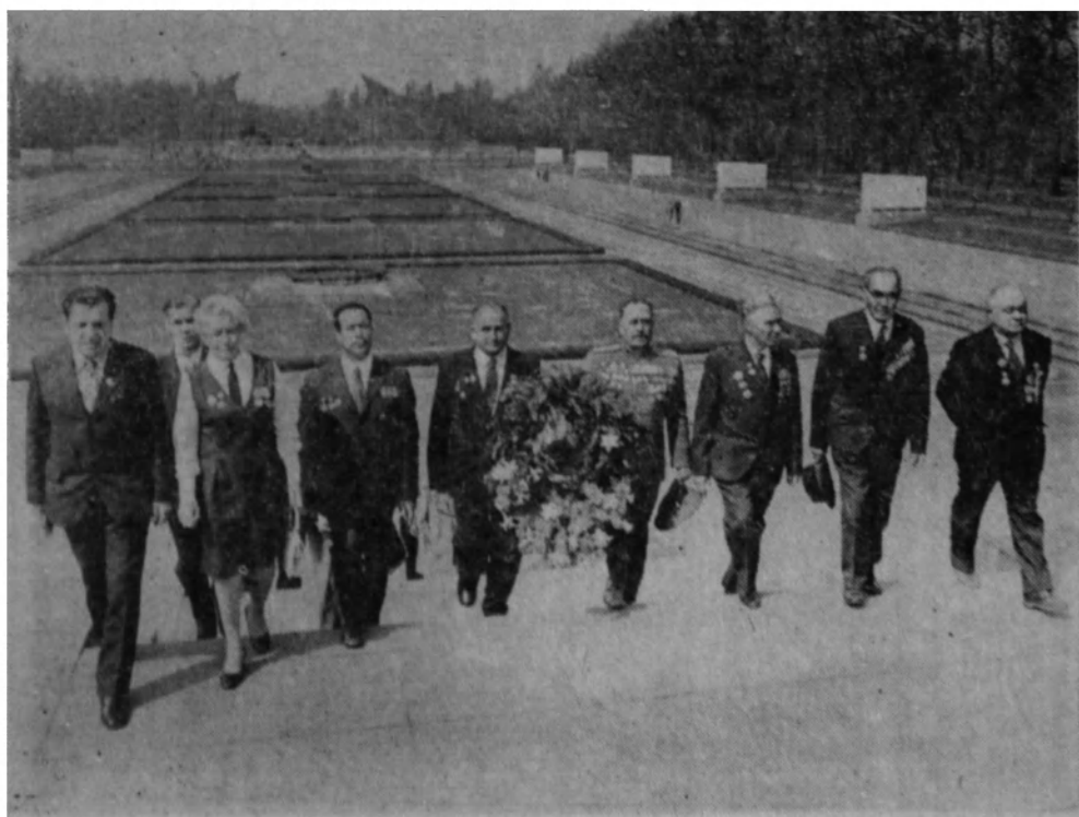
Берлин, Трентов парк. Совет чаачылар сыырадына чахаяхтар салтылча.

чатхан чон турыбыстыр. Писті көр салбинац, аяларын саап, хайназа түстүлөр. Хол тудыс, хуахтас, күлүнө — тиксі парча. Мына писті хыгыртхан «Фрайе — Вельт» журнал редакциязының тогынчылары өөн редакторы Ноахим Уханняц хада партиянай организациядац кизилер паза Германиянац Совет Союзының ынархас обществозының кизилери.