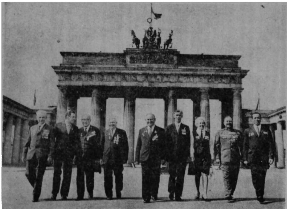
Чаа матырлары Бранденбург халхалары хырында.

Мына, онынчы паза он пірінчі страницада – ікі страницаа толдыра улуг сом. Сомның үстүнде піди пазыл партыр: «Оларның аттарын кем адир?» Ол сомны 1945 чылда 2 майда Берлинде чаа корреспонденті Евгений Халдей суурган полтыр. Сомны көрбинен, мин Бранденбург халхаларын танып салгам. Алтында мындаг сөстөр назылтыр: «Огонек» паза Германияна Совет Союзының ынархас обществозы сыгарчатхан «Фрайс-Вельт» журналлар пу митингте полган чаачыларцы тілен табарга чаратханнар. Кем поэын фотографияда табар? Кем мындагы чаачыларның аразына поэынның арғызын, чаачы нанчызын таныза, ш чагыныхы кізізін таап, аннаңар чоохтир? Писсер пазыңар.