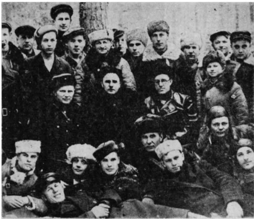
«Туттырбачацнар» тип партизаннар бригадазының кизілері.

изен-хазых. Сагам ол Гродно городта прокуратура следователы полып тогынча.