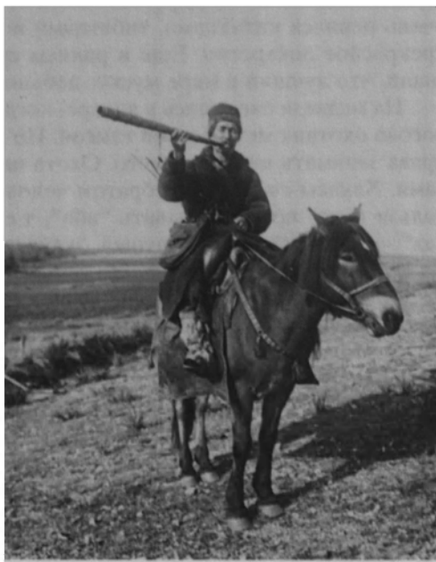
Охотник-сагаец на зове маралов с горном пыргы в руке. 1912.

В Саянских горах водилась кабарга. Охотились на нее при помощи специаль-