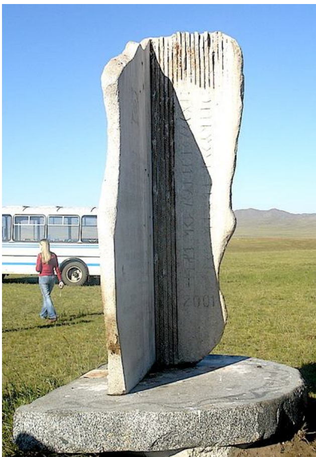
3. Так называемый Камень Мессершмидта в Усть-Абаканском районе – памятный знак на месте находки стелы с рунической надписью